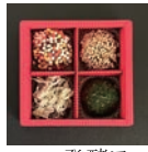
発酵ワークショップ 味噌玉 ¥1500(11時~11時45分) 玉ねぎ麴 ¥4000(13時~14時) 天然酵母パンと発酵食 Blessing