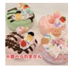
ドーナツデコ ハンドメイドショップ flagsflag ¥1100(20分)