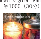
オリジナル CANDLE キャンドル akibi_hitomi ¥800(20分)