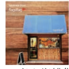
ハンドメイド雑貨 ハンドメイドショップ flagsflag