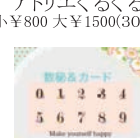
数秘&カード Polaris☆M&R ¥1500(10分~)