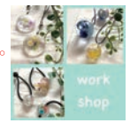
お花の アクセサリ *COCO HANA* ¥500 ~ (20分)