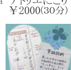
筆跡診断 trefle ¥2500(20~30分)