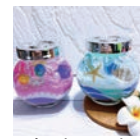
サンドアート ハンドメイドショップ flagsflag ¥500(20分)